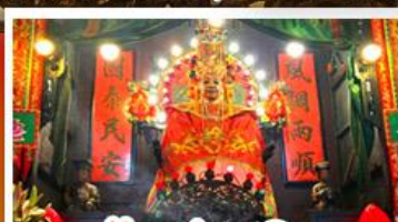
วัดเขกงเหมียว