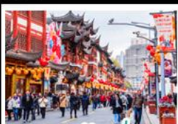
เฉิงหวิงเมี่ยว