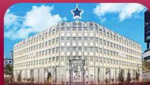
ย่านซองซู