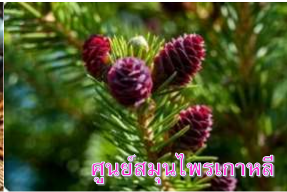
ศูนย์สมุนไพรเกาหลี

หลังจากนั้นนำท่านเดินทางสู่ย่าน เมียงดง (MYEONGDONG) ย่านช้อปปิ้งใจกลางกรุงโซลที่เต็มไปด้วยร้านค้า ห้างสรรพสินค้าชื่อดัง ร้านอาหารริมทางมากมาย โดยเมียงดงนั้นเป็นแขวงหนึ่งในเขตกรุงโซล มีพื้นที่เป็นที่ตั้งของร้านค้ากระจายตัวไปทั้งฝั่งตะวันออกและตะวันตก มีห้างสรรพสินค้าขนาดใหญ่ มีร้านขายสินค้าแบรนด์เนมมากมาย และยังมีสถานที่ท่องเที่ยวอันเป็นแลนด์มาร์กยอดนิยมมากมายด้วย อิสระให้ท่านได้เดินเล่นเลือกซื้อสินค้าตามอัธยาศัย