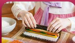
เรียงทำคิมบับ

สัมผัสเสน่ห์ฤดูหนาวของเกาหลีแบบอบอุ่นหัวใจพิเศษ! พักสกีรีสอร์ท 1 คืน ท่ามกลางบรรยากาศหิมะขาวโพลน สนุกกับกิจกรรมฤดูหนาวยอดนิยม ทั้งสกี สโนว์บอร์ดและสโนว์สเลด ก่อนออกเดินทางสู่เกาะนามิ ดินแดนแห่งความโรแมนติก ซิมสตรอว์เบอร์รี่หวานฉ่ำ สด ๆ จากฟาร์ม พร้อมเรียนทำคิมบับเมนูยอดฮิตสไตล์เกาหลี ปิดท้ายด้วยการช้อปปิ้งสินค้าเมืองคยองและซองซู ย่านอิคทีสายคาเฟ่และสายแฟชั่นห้ามพลาด