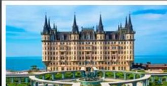
ไรไวน์และคฤหาสน์งามอยู่