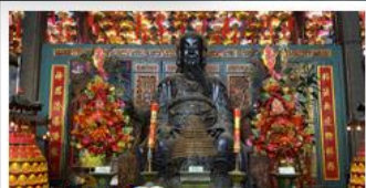
วัดบิกิตฮองฮำ