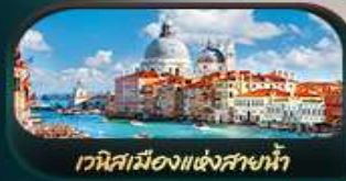
เวนิสเมืองแห่งสายน้ำ