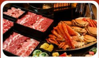
บุฟเฟ่ต์ซาบู ซาปู 3 ชนิด