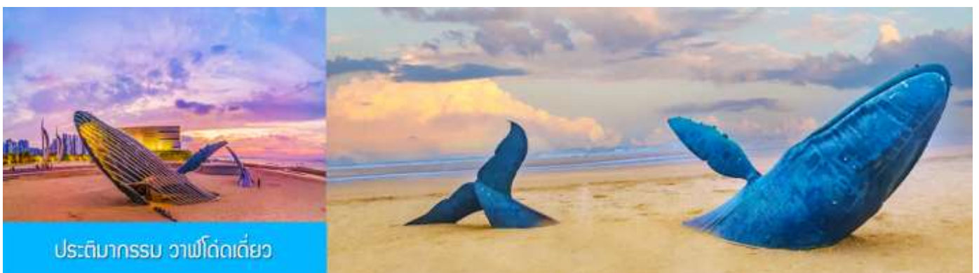
ประติมากรรม วาฬโดดเตี๋ย

นำท่านชมซุ้มประตูเฟิงไหล พระราชวังมังกง พระราชวังราชินีแห่งสวรรค์ และศาลาหลัก ชมทัศนียภาพอันตระการตาของเขตแดนทะเลเหลือง-ทะเลป้อไห่ ชม " ศาลาอมตะทะยานสู่ท้องฟ้า " จากนั้นนำท่านเดินทางไปยัง จุดชมวิวแปดเซียนข้ามทะเล ชมสถานที่สำคัญอันเป็นสัญลักษณ์ เช่น หอคอยเซียนหยวน กำแพงแปดเซียน และศาลาสู่เซียน โครงสร้างรูปทรงน้ำเต้าที่ล้อมรอบด้วยทะเลทั้งสามด้าน เชื่อมโยงตำนานแปดเซียนเข้ากับ ความมหัศจรรย์ของภาพลวงตา