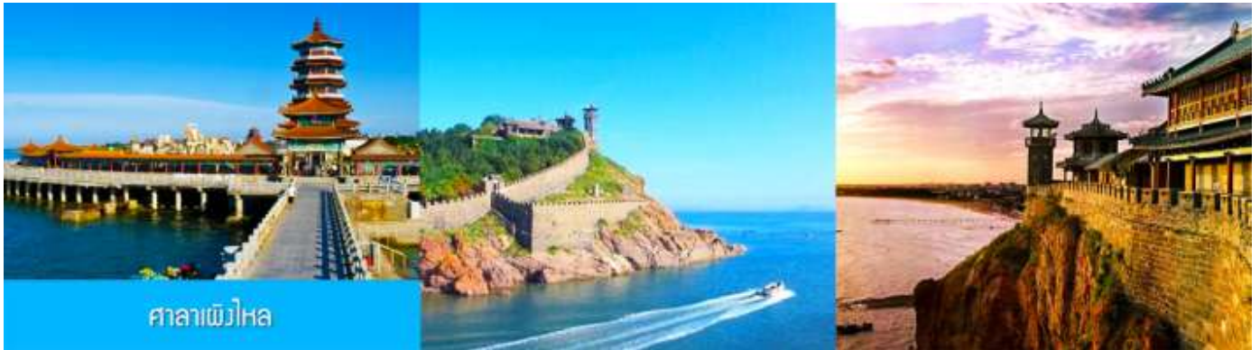
ศาลาเพิงไหล

จนได้เวลาอันสมควรนำท่านเดินทางสู่ คฤหาสน์เหวินเจิง 文成城堡 คฤหาสน์สไตล์ยุโรป ที่ตั้งตระหง่านอยู่ริมทะเลในเมืองเยียนไถ ที่นี่ไม่ใช่แค่สถาปัตยกรรม แต่คือ ประตูลูกโลกแห่งจินตนาการที่ท่านจะได้สัมผัสความหรูหรา และได้สัมผัสกับสถาปัตยกรรมสไตล์บารอกที่ยิ่งใหญ่ เหมือน หลุดเข้าไปในเทพนิยายของยุโรป ให้ท่านเก็บภาพบรรยากาศตามอัธยาศัย จนได้เวลาอันสมควร นำท่านเดินทางสู่ภัตตาคาร