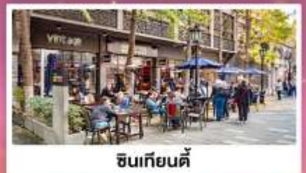
ชิวเกียนตี้