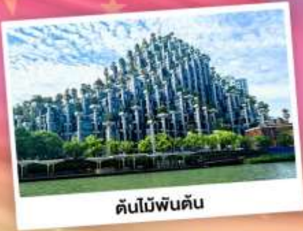
ต้นไม้พันต้น