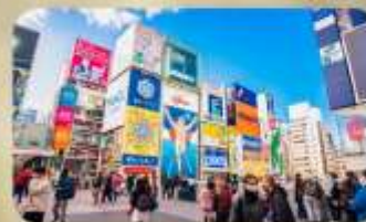
ซูปป์ิงชินโซบาชิ