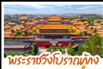
พระราชวังโบราณทุกยุค