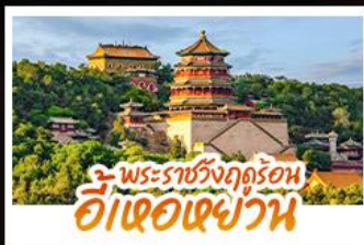
พระราชวังฤดูร้อน อู่เต๋อเซ่ย์วัน