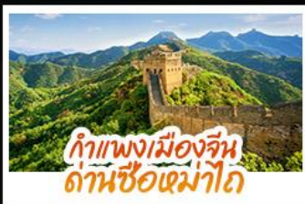
กำแพงเมืองจีน ด่านซือหม่าโต