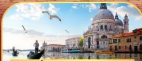
นั่งเรือสุกาะเวนิส