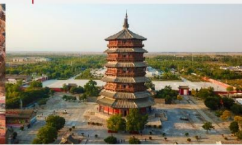
วัดเจดีย์ไม้ มู่ตา

*ทางบริษัทฯ ขอสงวนสิทธิ์ในการสลับโปรแกรมทัวร์ตามความเหมาะสมขึ้นอยู่กับสถานการณ์หน้างาน โดยคำนึงถึงผลประโยชน์ของลูกค้าเป็นสำคัญ