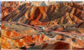
ภูเขาสายรุ้งจางเย่ต้นเสี่ย