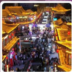
ตลาดจางเย่