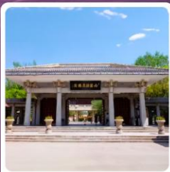
อุทยานประวัติศาสตร์จิวจวน