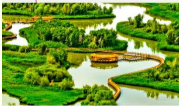
อุทยานพื้นที่ชุ่มน้ำจางเย่