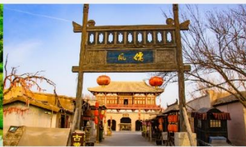
เมืองโบราณตุนหวง