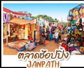
ตลาดช้อปปิ้ง JANPATH