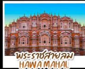
พระราชสาลม HAWA MAHAL