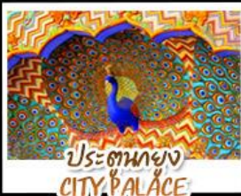
ประตูของ CITY PALACE