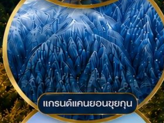
แกรนด์แคนยอนซูยกุน