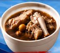
บะกุตเต้