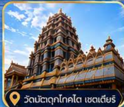
วัดมัตตุกโกโต เซดเตียร์