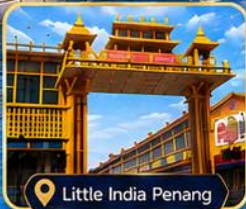
Little India Penang