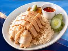
ข้าวมันไก่ปีนัง