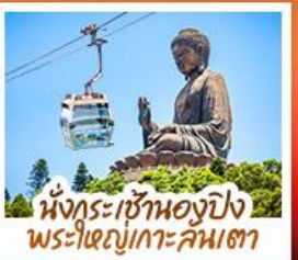
นั่งกระเช้าองปิง พระใหญ่เกาะคันทา