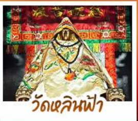
วัดเสลินฟ้า