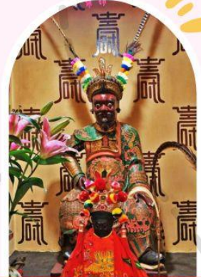
วัดเซกกองเก่าแก่ 400 ปี ไซกง