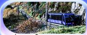
นั้งรถรางขึ้นยอดเขาฟลอม

เปิดประสบการณ์สุดว้าว... สักครั้งในชีวิต! ล่องเรือชมฟยอร์ด นั่งรถไฟสายโรแมนติกฟลอมสบวนา เบอร์กิน ชมเมืองท่าบรีคเกน นั่งรถรางขึ้นยอดเขาฟลอยนชมิวเมือง ไมควรฟลาดนัง Cable car ขึ้นยอดเขาอูริเคน ชม Top view ตระการตา ความอลังการระดับมาสเตอร์พีซ จุดชมวิวสตาสไตน์ เดินเล่นตลาดปลาเบอร์กิน ขึ้นชมโบสถ์ออสโลเยี่ยมชมโอเปร่าเฮาส์ มหาวิหารออสโล ป้อมปราการอาครส์ฮุส รัฐสภาแห่งนอร์เวย์ สวนอนุสรณ์ Vigeland Sculpture Park ซุปป์ิงถนน Karl Johans gate