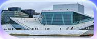
โอเปร่าเฮาส์

07-15 ต.ค.69 / 16-24 ต.ค.69 13-21 พ.ย. 69 / 04-12 ธ.ค. 69 25 ธ.ค. 69 - 02 ม.ค. 70 (ปีใหม่)