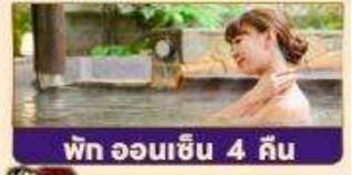
พัก ออนเซ็น 4 คืน