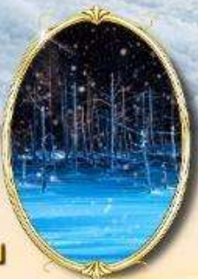
Shirogane Blue Pond Illumination