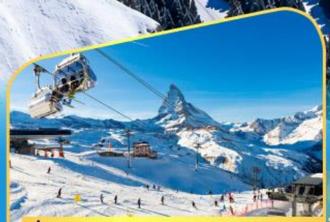
นั่งกระเช้าชมแมทเทอร์ฮอร์น