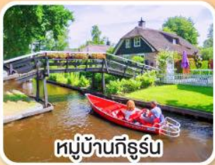
หมู่บ้านกังหัน