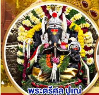
พระตรีศูล ปูणे (Trishul Pune)