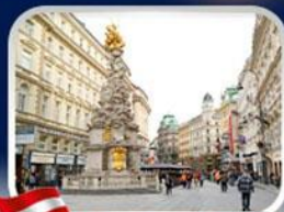
ช้อปปิ้งคาร์ทเนอร์สตรีก