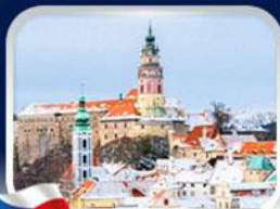
เมืองเชสกี ลุมลอฟ