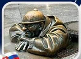
ประติมากรรม Cumil

มาเรียนพลักซ์ • บ้านเกิดโมสาร์ท • พระราชวังฮอฟบวร์ก • ซาลส์บวร์ก • บ้านเกิดโมสาร์ท • เกรโกเดร์สตรีก • ทะเลสาบคอนิกซ์ • หมู่บ้านอัลส์สตัดท์ • อนุสาวรีย์มาเรียเทเรซา