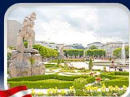
สวนมิราเบิล ซาลซ์บวร์ก