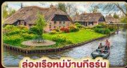
ล่องเรือหมู่บ้านทีร์ูร์น