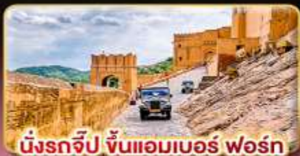
มิงรถจี๊ป ขึ้นแอมเบอร์ ฟอรั่ม