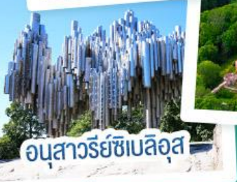
อนุสาวรีย์ซีเบลึส