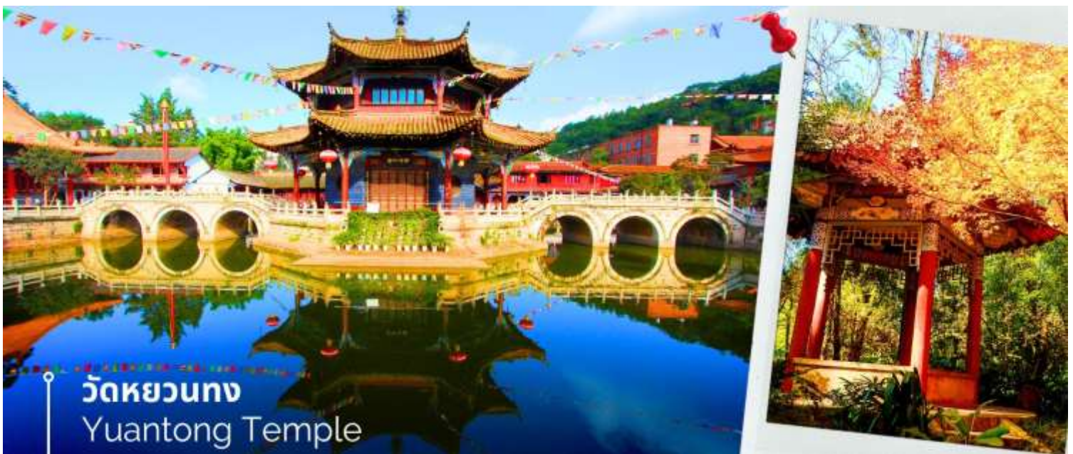
วัดหยวนทง Yuantong Temple

นำท่านชม วัดหยวนทง (Yuantong Temple) วัดแห่งนี้เป็นวัดที่ใหญ่และเก่าแก่ที่สุดในเมืองคุนหมิง สร้างมาตั้งแต่สมัยราชวงศ์ถัง มีอายุยาวนานประมาณ 1,200 กว่าปี การสร้างวัดแห่งนี้จะแปลกตากว่าวัดอื่นในจีน เพราะปกติแล้วการสร้างวัดของจีนส่วนมากจะต้องสร้างอยู่บนภูเขา แต่วัดหยวนทงสร้างวัดต่ำกว่าภูเขา โดยวิหารจะอยู่ต่ำที่สุดเนื่องจากวัดแห่งนี้ไม่ได้สร้างขึ้นเพื่อเป็นวัดโดยตรง แต่เคยเป็นศาลเจ้าแม่กวนอิมมาก่อน