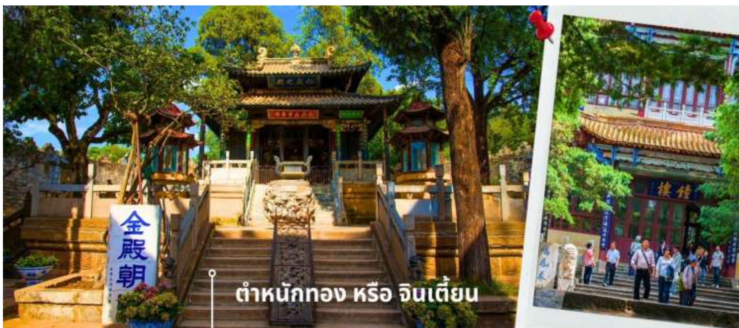
ตำหนักทอง หรือ จินเตี้ยน